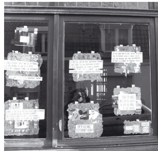
Textes écrits par un détenu et mise en valeur par une création de Gice qui furent exposés chez des habitants.