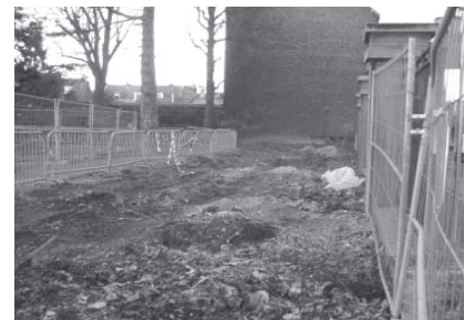
Les arbres abattus coté église et rue Wasquez-Lalo