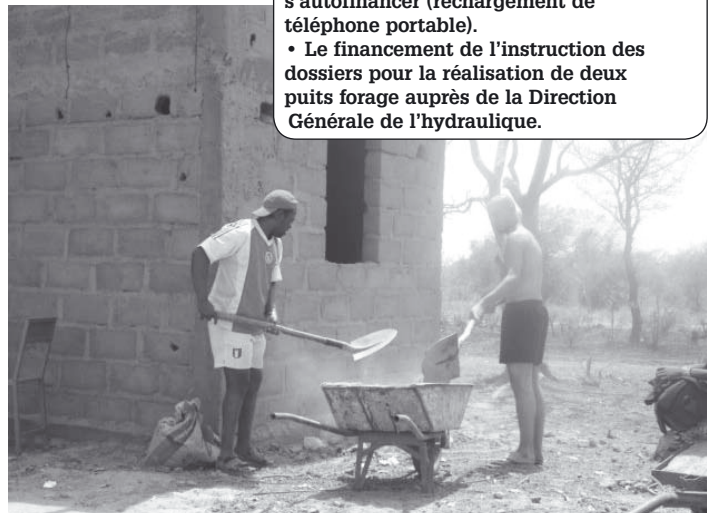
Chantier du logement de fonction réalisé en mars 2007