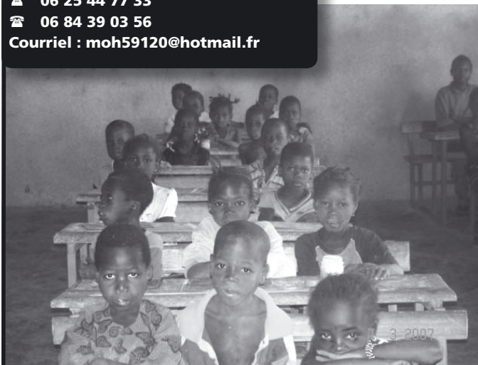
Classe de CP 1 de 57 enfants (construction réalisée en juillet 2004) - photo réalisée en mars 2007