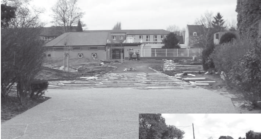
Le jardin côté rue du Maréchal Foch