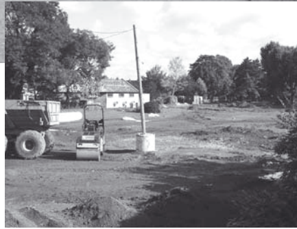
Le cercle des marronniers disparus...

Ce projet mégalomane reflète bien l'attitude de la municipalité et le respect qu'elle porte envers des citoyens (administrés est peut être le mot qui convient mieux). Qui a besoin d'allées de plus de 4 mètres de large dans un parc de 1600 m 2 ? Qui sont les commerçants qui